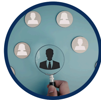
Búsqueda de candidatos