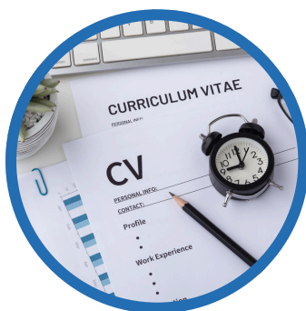
Entrevistas por competencias