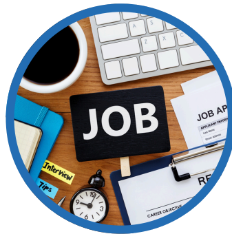
Publicación de Vacante