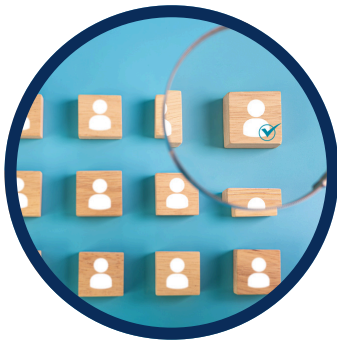
Levantamiento del perfil del cargo